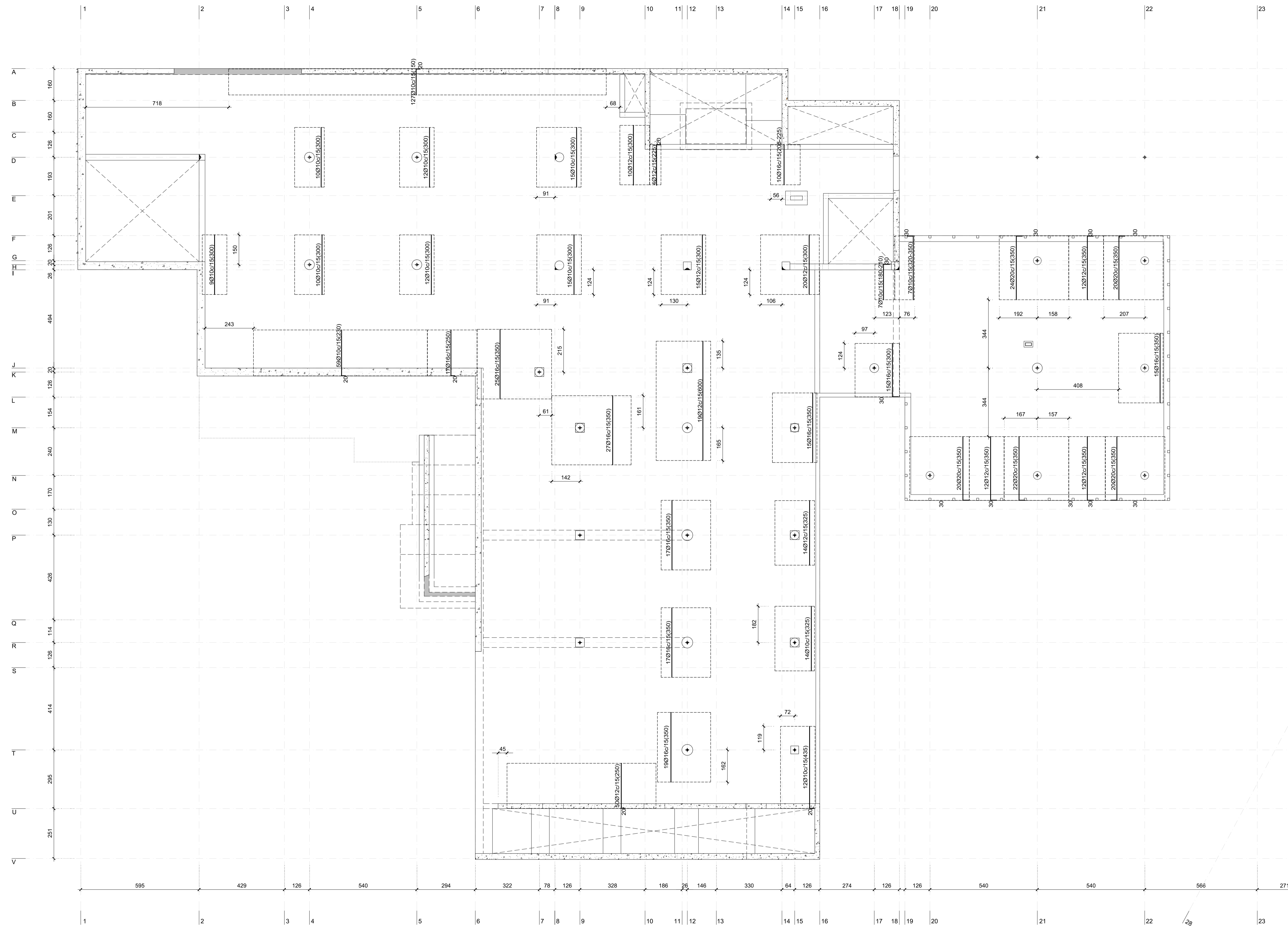
PLANTA NIVEL -1. (COTA -3.92 m) ESCALA: 1/100