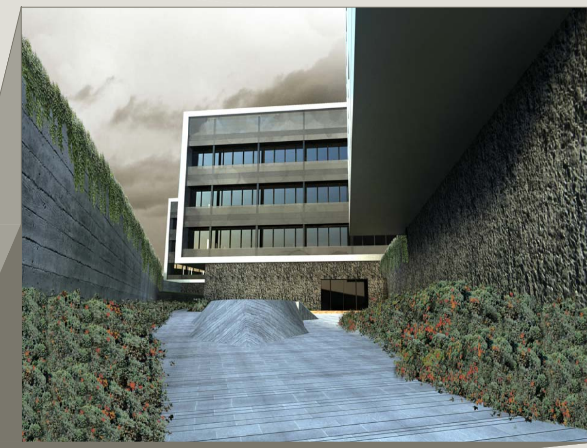
Imagen: Patio posterior del edificio, acceso garaje.